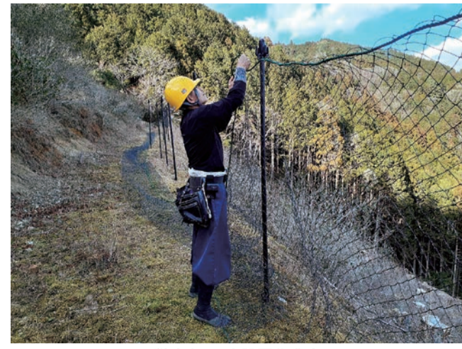
獣害ネットを設置作業中

令和4年度カモシカ防護柵設置補助事業が令和5年3月に完了しました。この事業はカモシカによる苗木の食害等を防止するために植付予定地の周囲に防護柵を設置するもので、当組合が静岡市より委託を受けて実施しております。令和6年3月以降に植付の予定があり、防護柵の設置を検討されている方は当組合までご連絡をお願いします。 ※カモシカ防護柵設置補助事業には要件