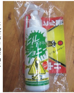
ヒル下ガりのジヨニー

込む可能性のある場所に散布しヤマビルが衣類の中に入るのを防止します。デイトの使用をしていないため、小さいお子様でも使用可能です。ヒル下ガりのジヨニーは組合購買にて販売中です。