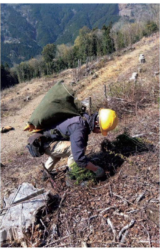
植付作業中の様子

が悪く、傾斜がある場所や滑りやすい場所で測量すること も多々あり、滑落などの危険 や測量の精度もまちまちにな る事がありました。しかしド ローンを導入したことによっ て、時間の短縮や危険地での 安全な測量が可能になりました。 また、ドローンでの空撮で ある為、測量する箇所だけ なく、周辺の状態把握も分か りやすい写真で確認すること が出来ました。そして、そし て、森林簿や現況簿を組み合 わせて作る計画図にも写真を 背景として図面に落とすこと で、より山林の現状を容易に 把握しやすくなるため、山林 所有者様への報告の際にも精 度の高い図面でお話すること が出来るようになります。