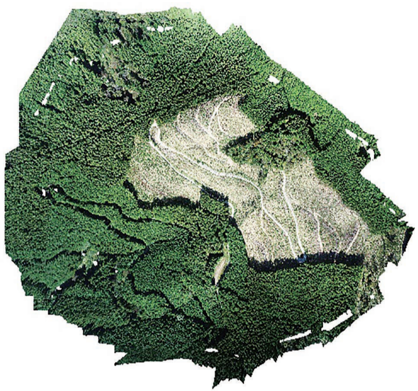
ドローンで空撮した写真