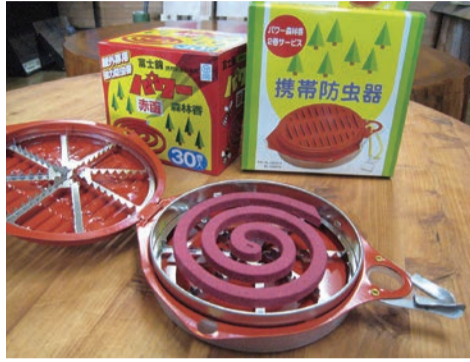
パワー森林香と携帯防虫器

厚みのある線香ですので、煙の量が一般的な蚊取り線香よりも多く屋外での森林作業、農作業、アウトドア用の防虫として適しています。