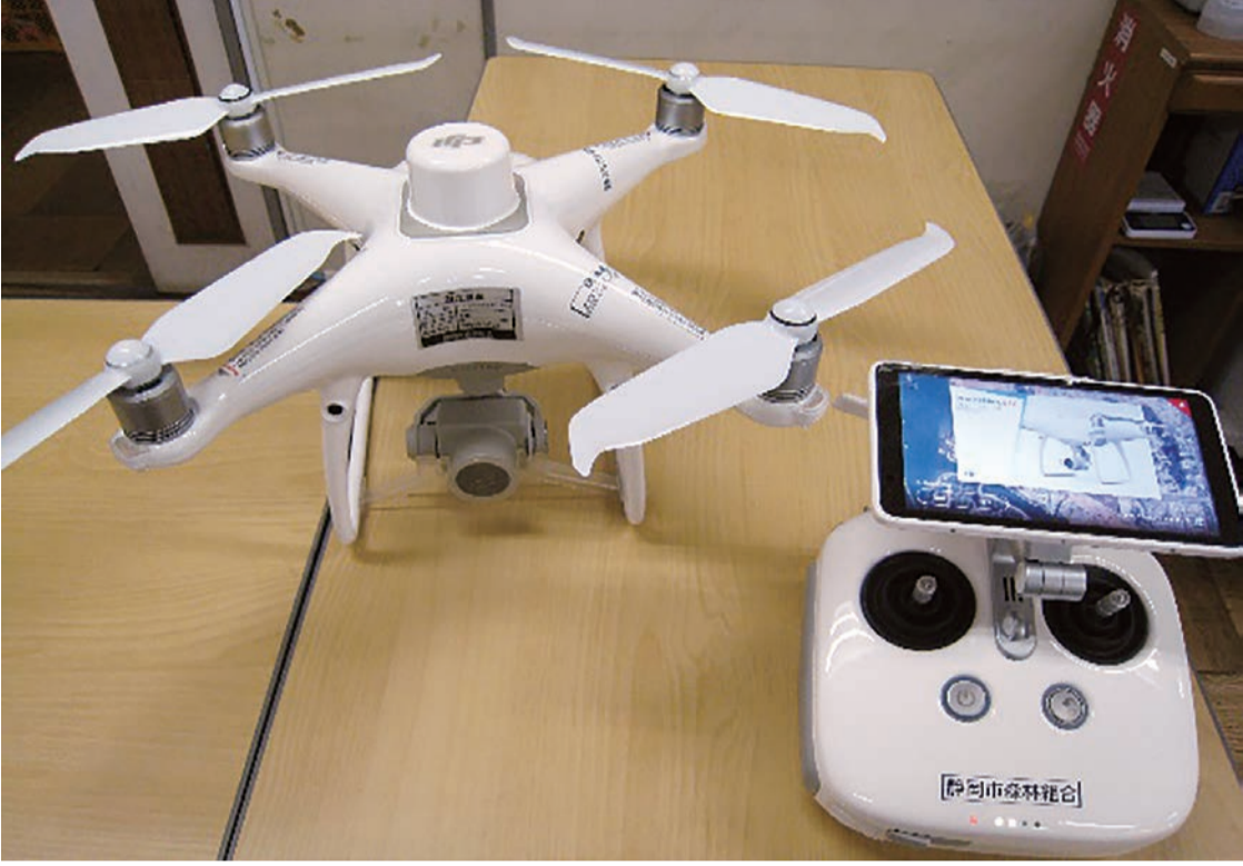
購入したドローン

令和4年8月8日に森林調査用としてドローン「PHANTOM 4 RTK」(ファントム4)を購入しました。今までは、山林調査として調